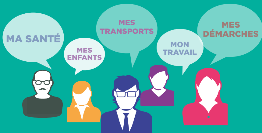
Schéma départemental d'amélioration de l'accessibilité des services au public